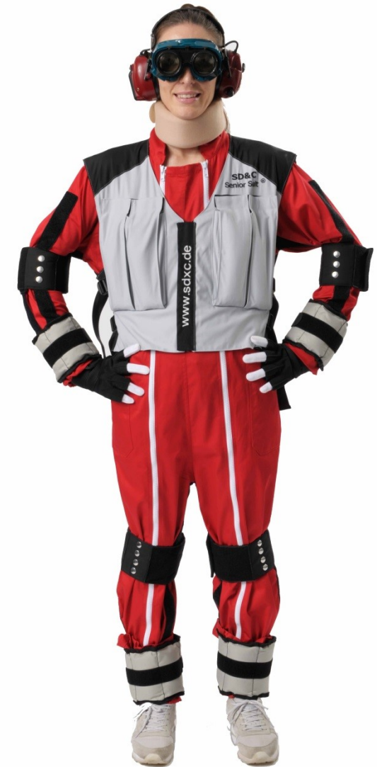
SD&C Senior Suit Beta 3: 2.250 € zzgl MwSt inklusive Lieferung